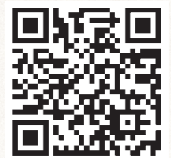
「あさくららん体操」

今まで転倒予防をキーワードに取り組んできた事業でしたが、様々な制限がある昨今、その地域の特色に合わせた活動が必要だと感じています。今までの固定観念にとらわれることなく、その地域の問題を捉え、何が必要で何ができるのか、そして行政との連携を大切にしながら考えていくことを大切にしたいと考えています。