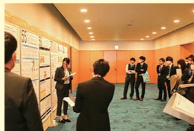
ポスター発表の様子